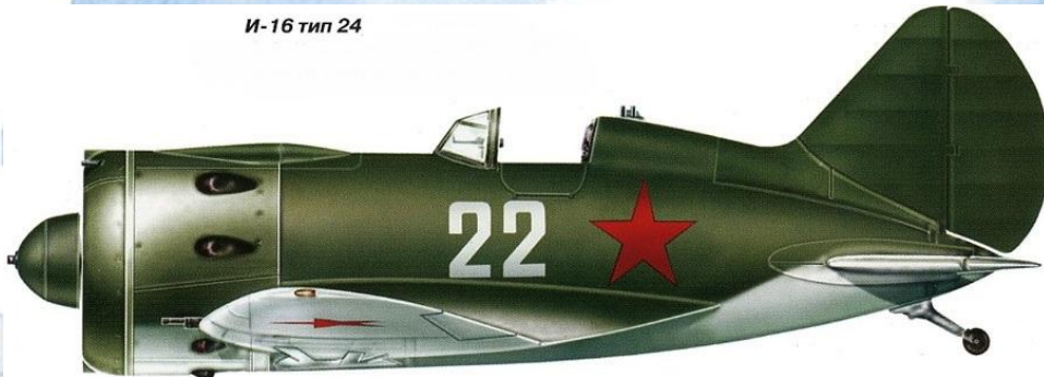
И-16 тип 24

Звено его истребителей вступило в бой с немецкими бомбардировщиками в первые минуты войны. В бою с очередной группой машин Люфтваффе советские пилоты израсходовали весь боезапас, топлива едва хватало дотянуть до аэродрома, но остановить немецкие машины было куда важнее, чем выжить. Поняв это, И. И. Иванов совершил первый в истории Великой Отечественной войны воздушный таран.